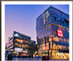
ย่านซานหลี่ตุ๋น