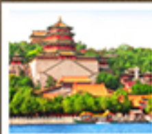
อวี่เหอหยวน