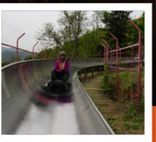
สไลเดอร์ลงจากกำแพงเมืองจีน