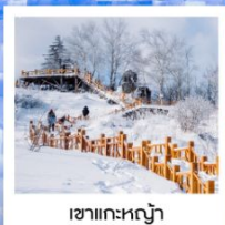
เขากระหลว้า