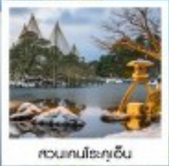
สวนคนโระกุจิน

วัดโองสึคันนง / ปราสาทนาโกย่า / ฮอนบิงซากาเอะ / ฮิซาคาวาโกะ / หมู่บ้านอิงาชิ ฮายะ / สวนคนโระกุจิน สกีเทนคิตสึยามะ / ค่องเรือฮอนอ่าวฮิเมะ / จุดชมวิวอาบะโนะฮะชิฮาระ / โทบะ ฮิบะชิ เปรี่เยียม เอากาเคอิ