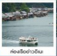
ค่องเรืออ่าวฮิเมะ