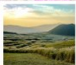
ทุ่งทานาคะเซนริ