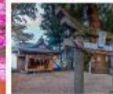
ศาลเจ้าคามิชิกิมิ

หมู่บ้านยูฟุอินฟลอร์รัล / สวนดอกไม้คจู จุดชมวิวโองังโง / ศาลเจ้าคามิชิกิมิ คุมาโนะอิมะสึ ทุ่งหญ้าคุสะเซนริ / โทสุ พรีเมียม เอ้าท์เล็ท