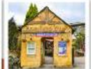
ยูฟุอิน ฟลอร์รัล