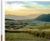
ทุ่งหญ้าคุสะเซนริ