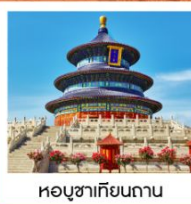
หอบูชาเทียนถาน