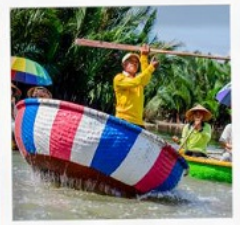
เรือกระดิง