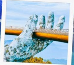
บาน่าฮิลล์