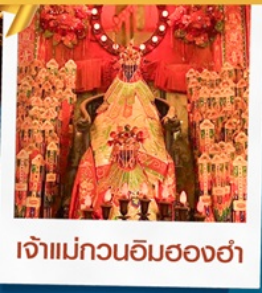
เจ้าแม่กวนอิมฮ่องกง

โรงแรม Eaton Hotel และ iclub Mong Kok Hotel