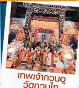
เทพเจ้ากวนอู วัดกวนไท่