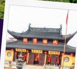
วัดพระหยก