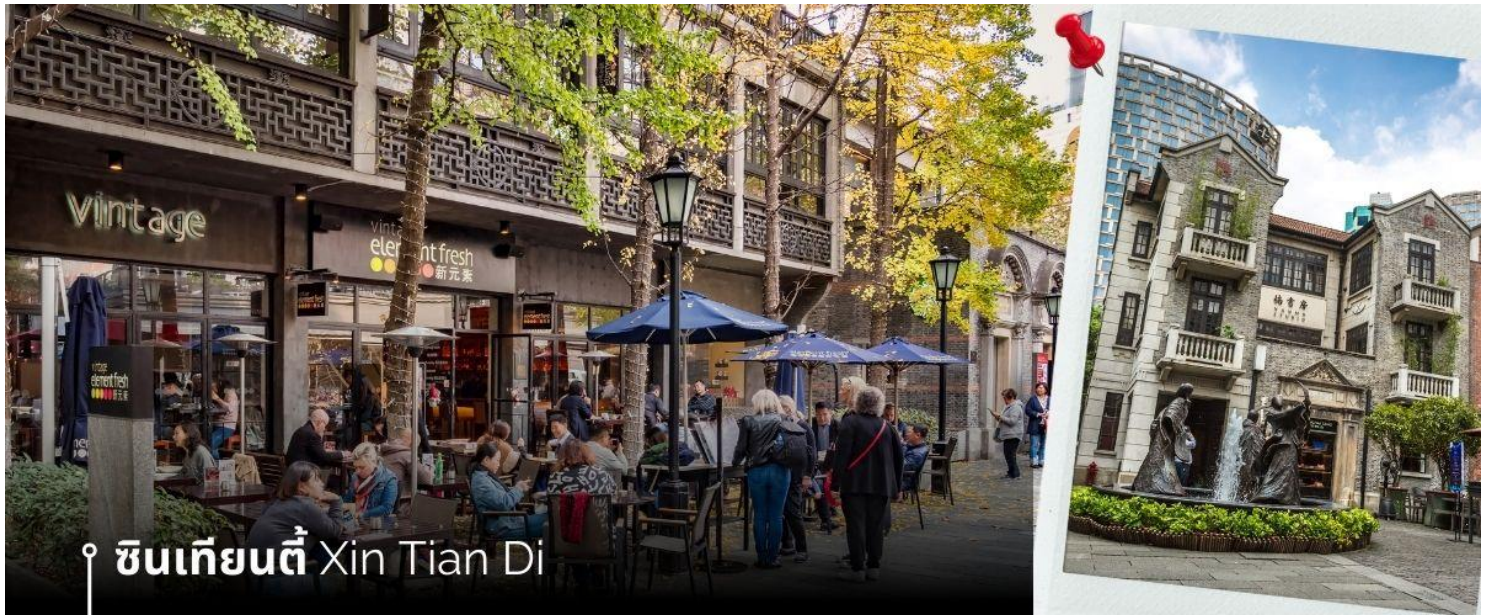
📍 ซินเทียนตี้ Xin Tian Di

นำท่านเที่ยวชม ซินเทียนตี้ ย่านฮิปเตอร์ใจกลางนครเซี่ยงไฮ้ ที่วัยรุ่นต้องมา กลายเป็นสถานที่ท่องเที่ยวติดอันดับต้นๆไปแล้ว สำหรับแหล่งช้อปปิ้งแห่งนี้ ไม่แพ้แหล่งช้อปปิ้งรุ่นพี่ อย่าง ถนนนานกิง ถนนอูเจียง Yu Yuan Bazaar ถือว่าเป็นอีก 1 ไฮไลท์เด็ดของนครแห่งนี้ เนื่องจากเอกลักษณ์ที่ไม่เหมือนใคร สิ่งปลูกสร้างที่ใช้อิฐบล็อกแบบสถาปัตยกรรมแบบ Shikumen (ซิกเหมิน) การผสมผสานระหว่างสถาปัตยกรรมตะวันตกกับจีนเข้าด้วยกัน ทางเดินหิน กำแพงหิน ประตูหิน บ้านเมืองเก่าแต่ดูแลรักษาอย่างดี