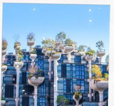
Tian An 1,000 Trees Square