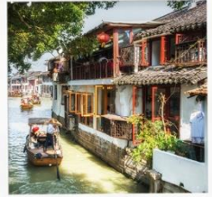
เมืองโบราณจูเจียวเจียว