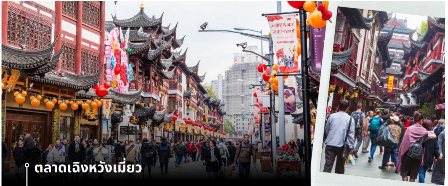
📍 ตลาดเจิงหวังเมี่ยว

จากนั้นนำท่านสู่ ตลาดเจิงหวังเมี่ยว เป็นศูนย์รวมสินค้า และอาหารพื้นเมืองที่แสดงถึงเอกลักษณ์ของชาวเซี่ยงไฮ้ซึ่งมีการผสมผสานระหว่างอดีตและปัจจุบันได้อย่างลงตัว ซึ่งเป็นย่านสินค้าราคาถูกที่มีชื่ออีกย่านหนึ่งของนครเซี่ยงไฮ้ให้ท่านอิสระช้อปปิ้งตามอัธยาศัย