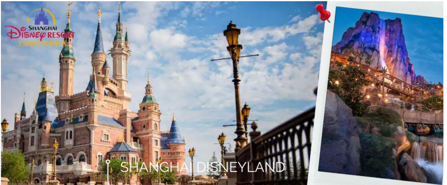
📍 SHANGHAI DISNEYLAND

เช้า 🍷 รับประทานอาหารเช้า ณ ห้องอาหารโรงแรม (3) นำท่านเข้าสู่ดินแดนแห่งความฝัน SHANGHAI DISNEYLAND เซี่ยงไฮ้ดิสนีย์แลนด์ แห่งนี้เป็นสวนสนุกแห่งที่ 6 ของดิสนีย์แลนด์ทั่วโลก มีขนาดใหญ่อันดับ 2 ของโลก รองจากดิสนีย์แลนด์ในออร์แลนโด รัฐฟลอริดา สหรัฐฯ และเป็นสวนสนุกดิสนีย์