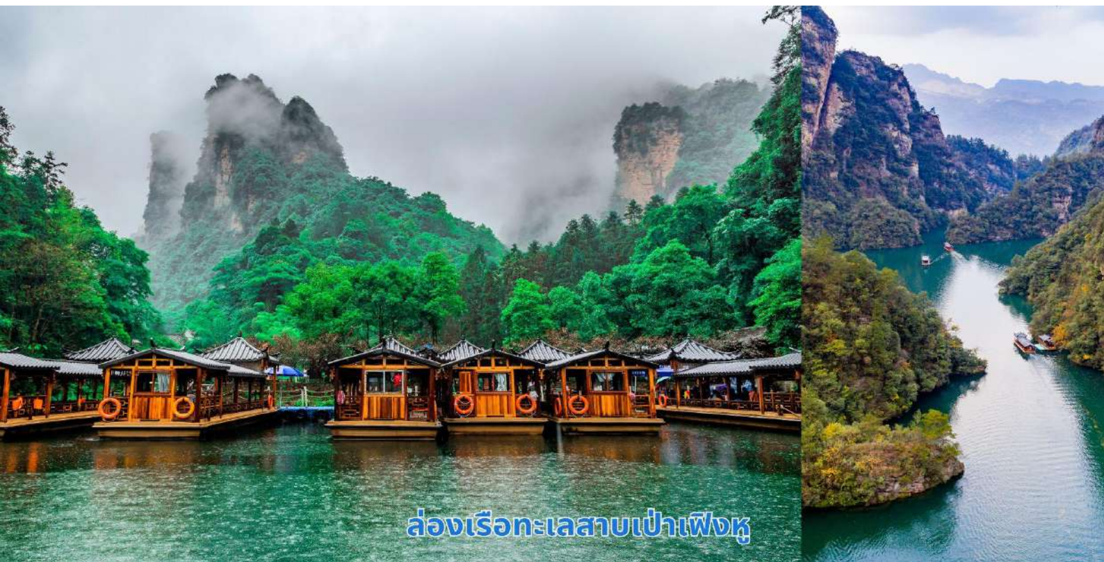
ล่องเรือทะเลสาบเป่าเฟิงหู