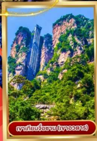
เขาเทียนจื่อซาม (เขาวงตาร)