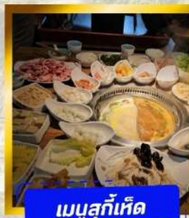
เมนูสุกี้เด็ด