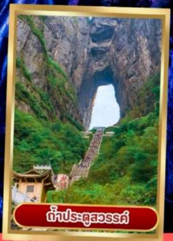
ถ้ำประตูสวรรค์