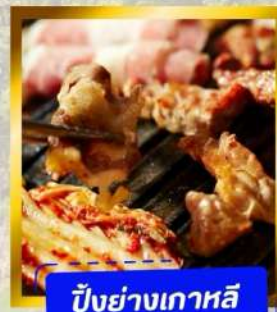
ปิ้งย่างเกาหลี