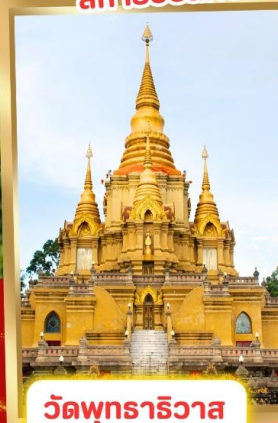
วัดพุทธาริวาส