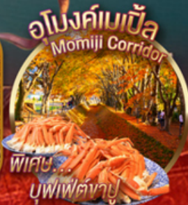
พิเศษ บูฟเฟ่ต์