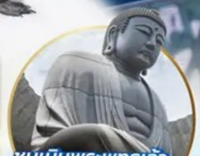
ชมเนินพระพุทธรเจ้า Hill of the Buddha

📍 ไฮไลท์!! สนุกสนานกับกิจกรรมทะเลหิมะ ณ ลานสโนว์ เวิลด์ ฮักไซฟาโนราม่า เยี่ยมชมเนินพระพุทธรเจ้า ชมความน่ารักเหล่าสัตว์ ณ สวนสัตว์อาซาฮิยาม่า ชมคลองโอดาธา เข้าชมพิพิธภัณฑ์ทักสโงดดนตรี ลีมรสรามง ณ หมู่บ้านราเมนอาซาฮิคาว่า ซอปปิงจูดิ กาบุกุคิอิ อีมอร์รอย!! บุปเฟ่ต์ซาบู และซาบูยักนั้