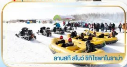
ลานสกี สโนว์ ฮักไซฟาโนราม่า