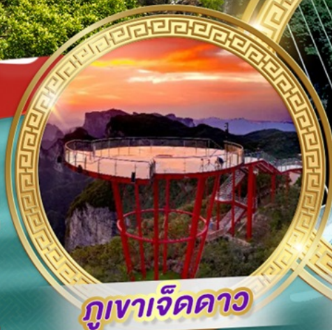
กูเงาเจ็ดดาว