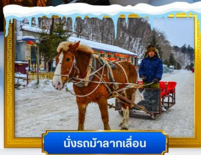
นั่งรถม้าลากเลื่อน