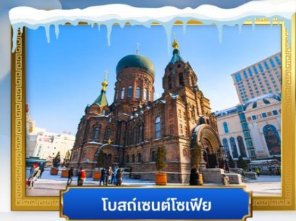
โบสถ์เซนต์โซเฟีย

เดินทางโดย : สายการบินโซน่า เซาท์จีน แอร์ไลน์