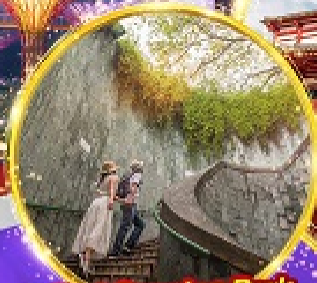
Fort Canning Park