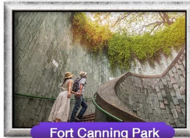
Fort Canning Park