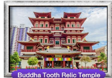
Buddha Tooth Relic Temple