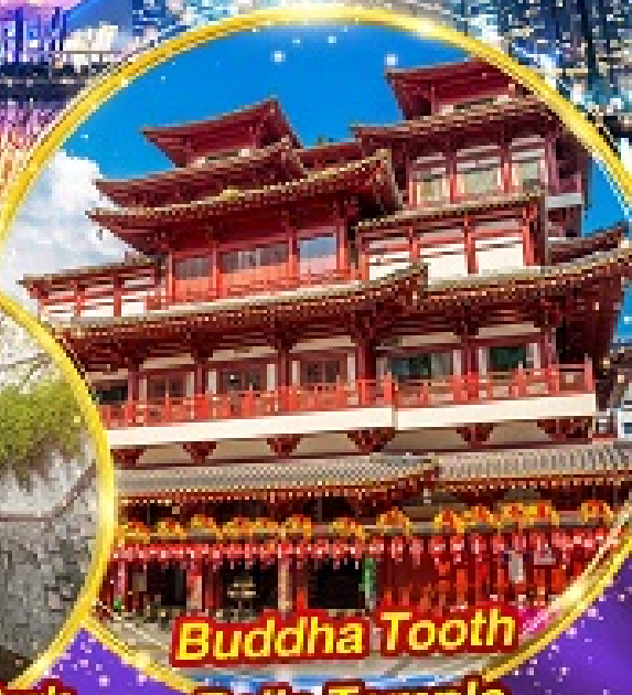
Buddha Tooth Relic Temple