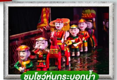
ชมโชว์หุ่นกระบอกน้ำ