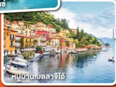
หมู่บ้านเบลลาจีโอ

พักค้างคืนมิลาน 2 คืน ซูริก 2 คืน ไม่ต้องเปลี่ยนโรงแรมบ่อย