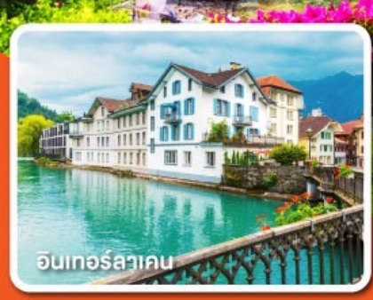
อินเทอร์ลาเคน