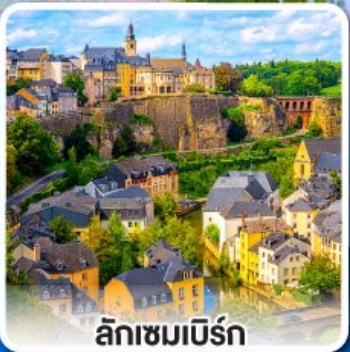
ลักเซมเบิร์ก

ล่องเรือ... ชมทัศนียภาพอันสวยงาม ตลอดสองฟากฝั่งของแม่น้ำไรน์