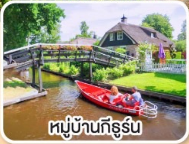
หมู่บ้านกังธูร์น