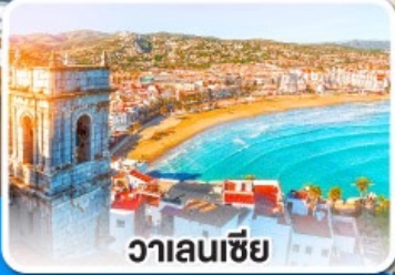
วาเลนเซีย