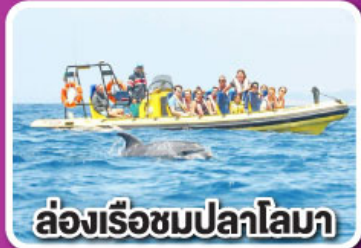
ล่องเรือชมปลาโลมา