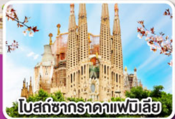
โบสถ์ซากราตาแฟมิลี