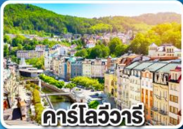
คาร์ลสไบร์