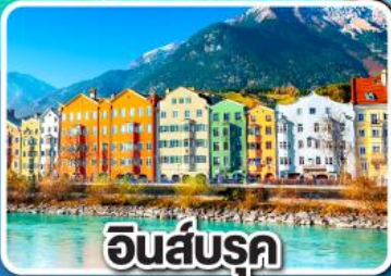
อินส์บรุค