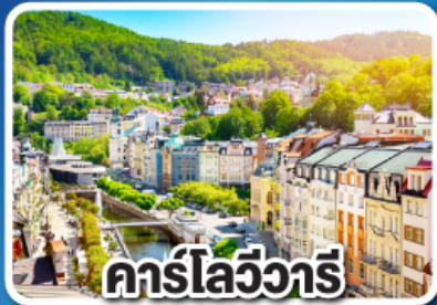
คาร์โลวารี