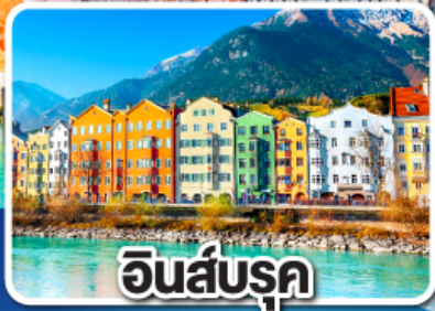
อินส์บรุค

อิตาลี ออสเตรีย เยอรมนี เชก สโลวาเกีย อังกฤษ 10 วัน 7 คืน