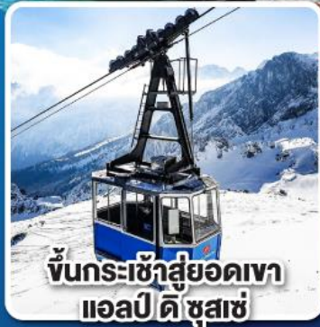
ขึ้นกระเช้าสู่ยอดเขา แอลป์ ดี ซูสแซ่

เที่ยวเมืองอินส์บรุค เพชรเม็ดงามสุดโรแมนติก แห่งแคว้นทิโรล ราคาเริ่มต้น