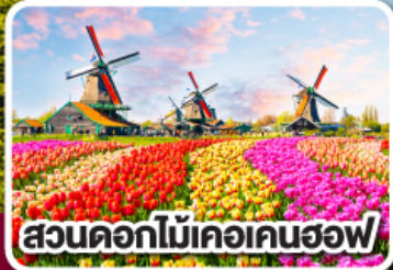
สวนดอกไม้เคอเคนฮอฟ

ดอกไม้ที่สดใส กับ หัวใจที่เบิกบาน ฝรั่งเศส เบลเยียม ลักเซมเบิร์ก เยอรมนี เนเธอร์แลนด์ 8 วัน 6 คืน