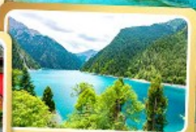
ทะเลสาบยาว