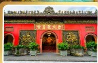
วัดต้าอ้อ