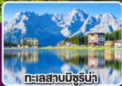
ทะเลสาบมิซูริน่า

เข้าชม ความงามดุจดังเทพนิยาย ของปราสาทน้อยชวานสไตน์