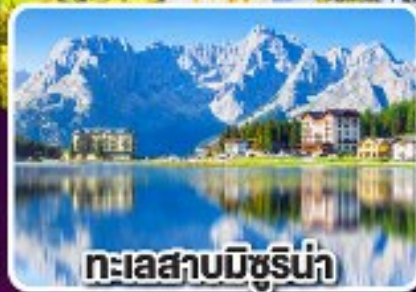
ทะเลสาบมิชรีน่า

เข้าชม ความงามดุจดังเทพนิยาย ของปราสาทน้อยชวานส์ไตน์