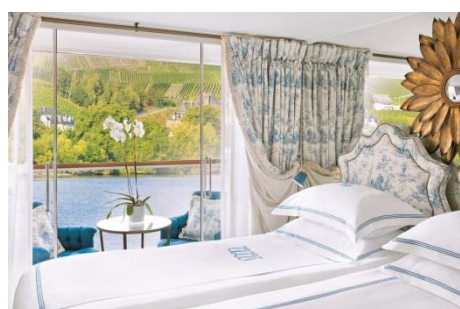
DELUXE BALCONY (DB) Luxurious riverview stateroom with open-air balcony I (18.2 SQ.M.)