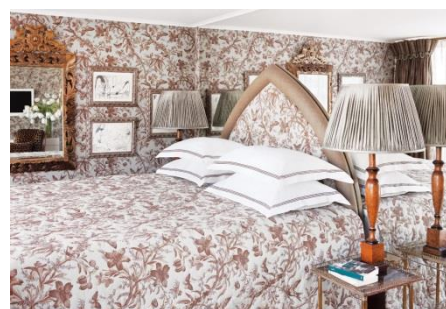
SUITE (SU) Luxurious riverview stateroom with open-air balcony I (27.3 SQ.M.)