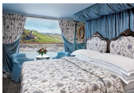
FRENCH BALCONY (FB) Luxurious riverview stateroom with a French balcony I (18.2 SQ.M.)