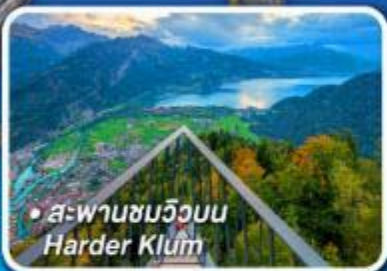
• สะพานชมวิวน Harder Klum