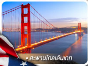
• สะพานโกลเดนเกต

★ เยือนอุทยานแกรนด์แคนยอน ฝั่ง South rim ความมหัศจรรย์ทางธรรมชาติ ที่ยิ่งใหญ่ที่สุดแห่งหนึ่งของโลก