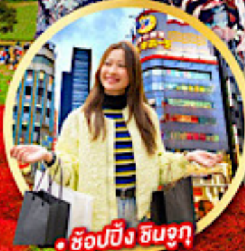
• ช้อปปิ้ง ชินจูกุ

กิจกรรมใส่ชุดกิโมโน พร้อมชมโชว์การแสดงต่างๆ