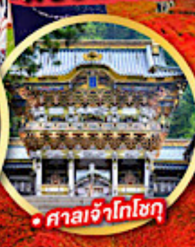
• ศาลเจ้าโทโชกุ