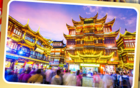
ตลาดร้อยปีเจิ้งหวังเมี่ยว