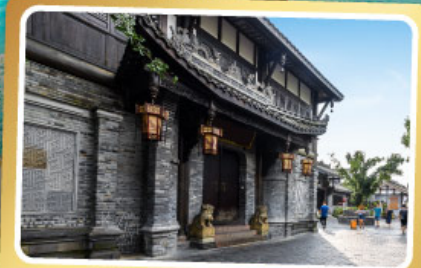
ถนนควานโจ้เซียงจื่อ