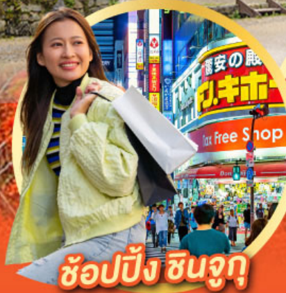
ช้อปปิ้ง ซินจูกุ

นั่งกระเช้าชมวิว ใบไม้เปลี่ยนสี Mt. Adatara