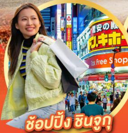
ช้อปปิ้ง ซินจูกุ