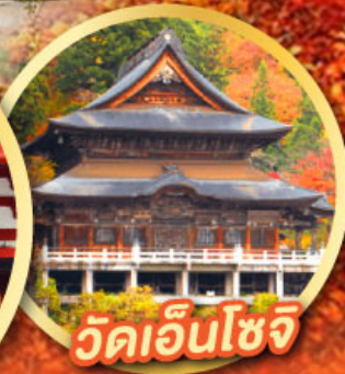
วัดเอ็นโซจิ

กิจกรรมเก็บผลไม้ พักออนเซ็น 2 คืน พักโรงแรมในโตเกียว 2 คืน