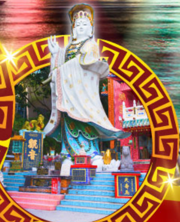
เจ้าแม่กวนอิม ทาดริฟส์ลีย์