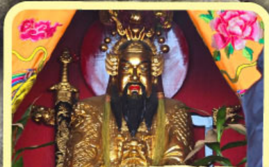
• เอียงบู๊ซัว (ศาลเจ้าพ่อเสือ)