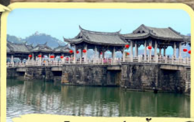
• สะพานโบราณกว้างจี้