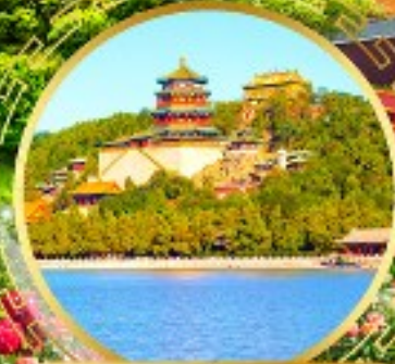
พระราชวังฤดูร้อน