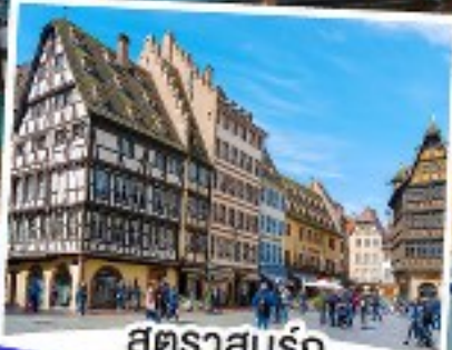
สตราสบูร์ก