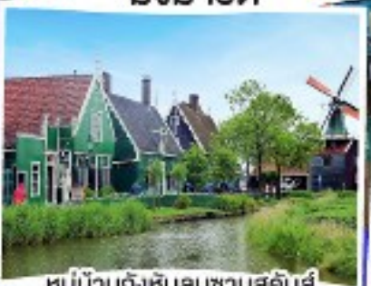
หมู่บ้านกังหันลมซานสคีนส์