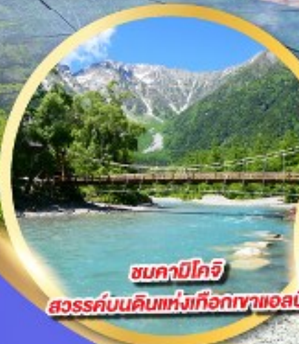
ชมคาบิโกจิ สวรรค์บนดินแห่งเทือกเขาแอลป์

นั่งกระเช้าลอยฟ้า 2 ชั้น ชินโฮทากะ หนึ่งในสุดยอดในญี่ปุ่น แลนด์มาร์กยอดฮิตของโอคุซึดะ