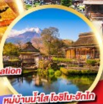
หมู่บ้านน้ำใส โอชิโนะฮัทโก