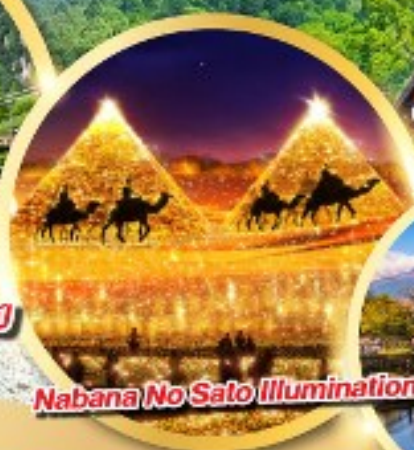
Nabana No Sato Illumination