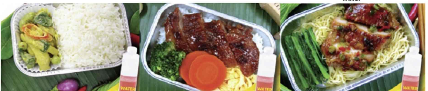
Chicken roasted with herb and noodle and water