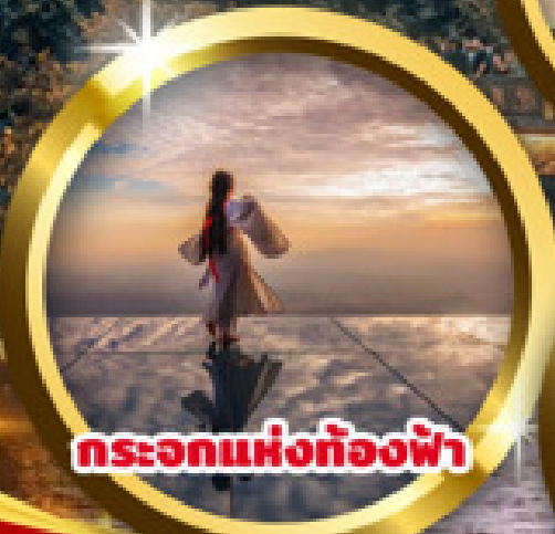
กระเอกแห่งท้องฟ้า