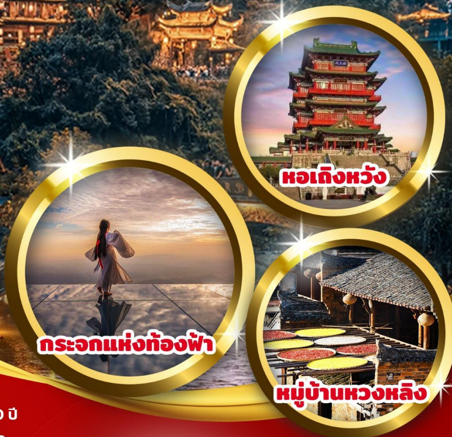
หอเถิงหวัง