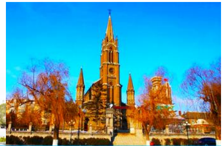
โบสถ์คอกอถิก