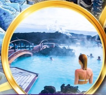
บ่อน้ำแร่บลูลาگون