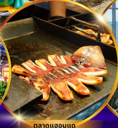
ตลาดแฮอุนแด