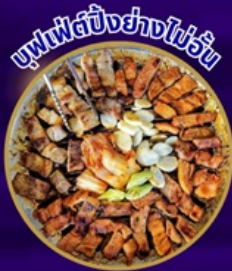
ซูฟเฟิลปูย่างไข่มุก