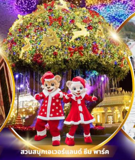
สวนสนุกเอเวอร์แลนด์ ฮิม พาร์ค