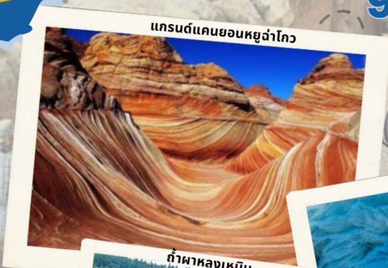
แกรนด์แคนยอนหลั่วโกว