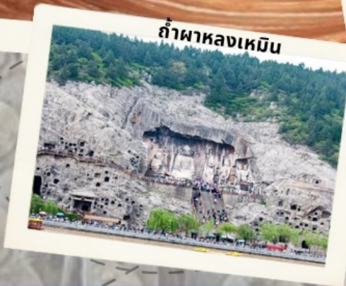
ถ้ำผาลงเหมิน