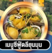
เมนูซีฟู้ดลิขุนบน