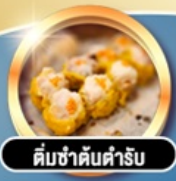
ต้มซ่าคั้นตำรับ