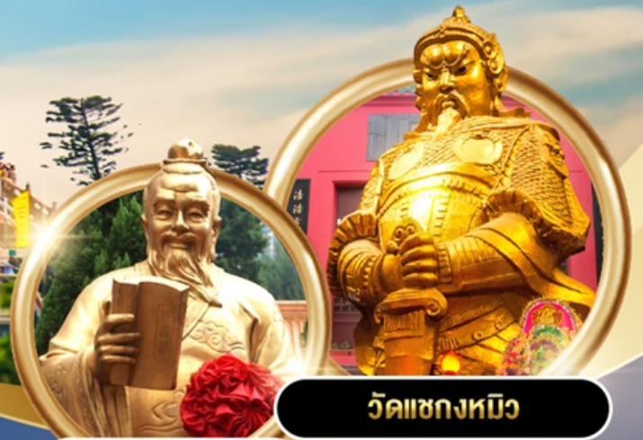
วัดเขกงหนิว