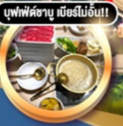
บุฟเฟ่ต์ชาบู เมื่อก่อน!!