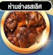
ทำอย่างรสเลิศ