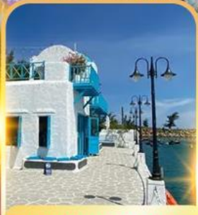
SON TRA MARINA CAFE