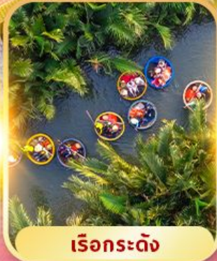
เรื่อกระดิง