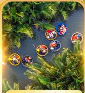
เรื่อกระดิง