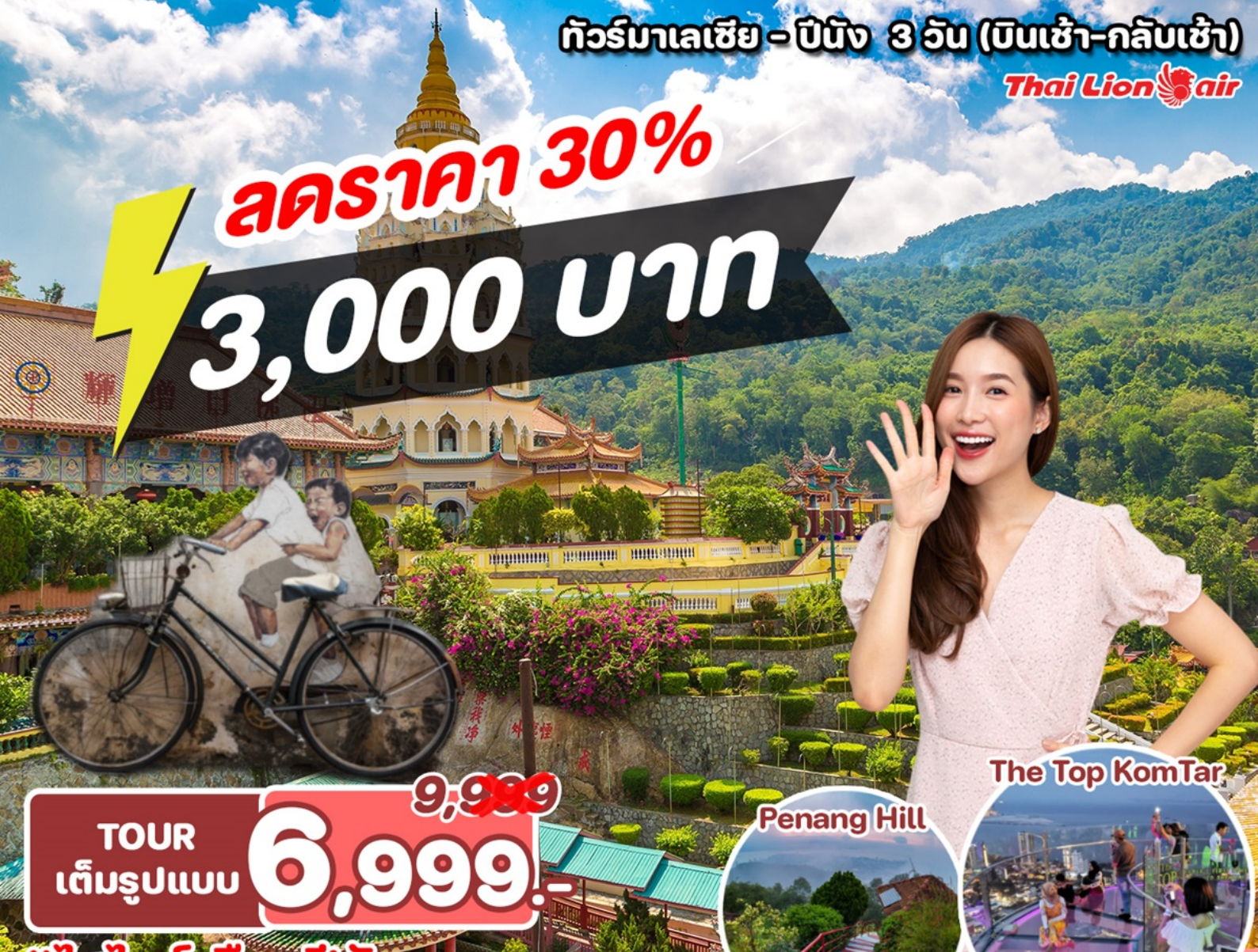
The Top KomTar