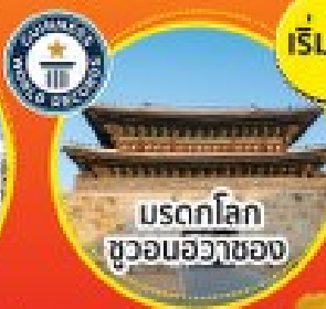
มรดกโลก คูวอนฮวาซอง