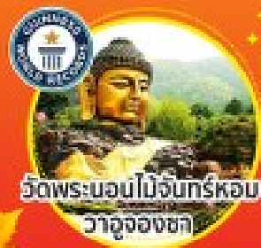
วัดพระบอนไม้จันทร์หอม วาจูจองซา