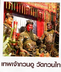
เทพเจ้ากวนอู วัดถวณไถ