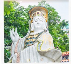
เจ้าแม่กวนอิมธิพลัสเบย์