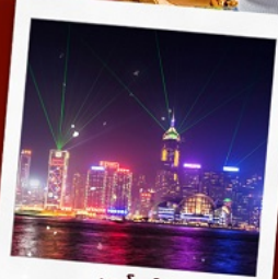
ชมโชว์ SYMPHONY OF LIGHT